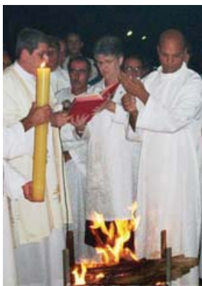
Batismo - Comunidade Santo Antonio

Vigília Pascal de 2007 Comunidade Santo Antonio Medeiros, Jundiá