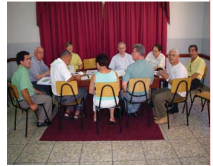
Dois momentos da Reunião da CRD Sul 1