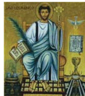
São Lourenço Diácono Padroeiro dos Diáconos