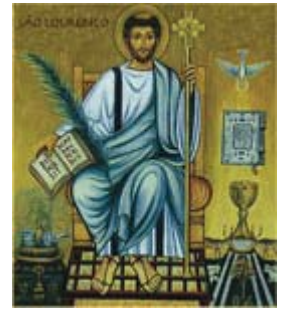
São Lourenço Diácono Padroeiro dos Diáconos

Diáconos por uma evangelização inculturada e uma sociedade sem excluídos