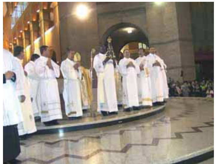
Diáconos com a imagem de Nossa Senhora Aparecida no final da Celebração do ano passado.