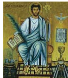
São Lourenço Diácono Padroeiro dos Diáconos

Diáconos por uma evangelização inculturada e uma sociedade sem excluídos