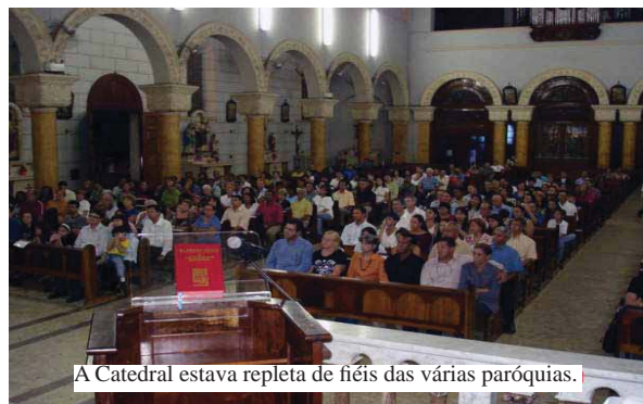
A Catedral estava repleta de fiéis das várias paróquias.