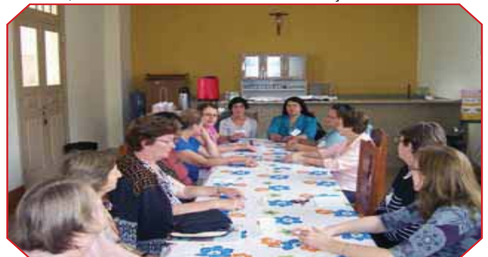
A Assembléia das esposas tornou realidade a Comissão de Serviço das Esposas dos Diáconos da CRD Sul 1.

Após a Missa, foi feita a plenária da reunião do Conselho Consultivo, encerrando-se o encontro com almoço.