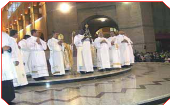
Grupo de Diáconos com a imagem de Nossa Senhora Aparecida, no final da Missa no Santuário Nacional.