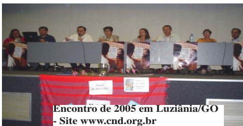
Encontro de 2005 em Luziânia/GO - Site www.cnd.org.br

A Comissão Nacional dos Diáconos – CND fará realizar o Encontro no período de 5 a 8 de fevereiro de 2009 no Mosteiro da Vila Kostka de Itaipú, Indaiatuba/SP.