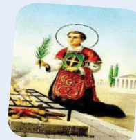
São Lourenço Diácono

INFORMATIVO DA COMISSÃO REGIONAL DOS DIÁCONOS SUL I ANO III - Nº 26 - NOVEMBRO DE 2008