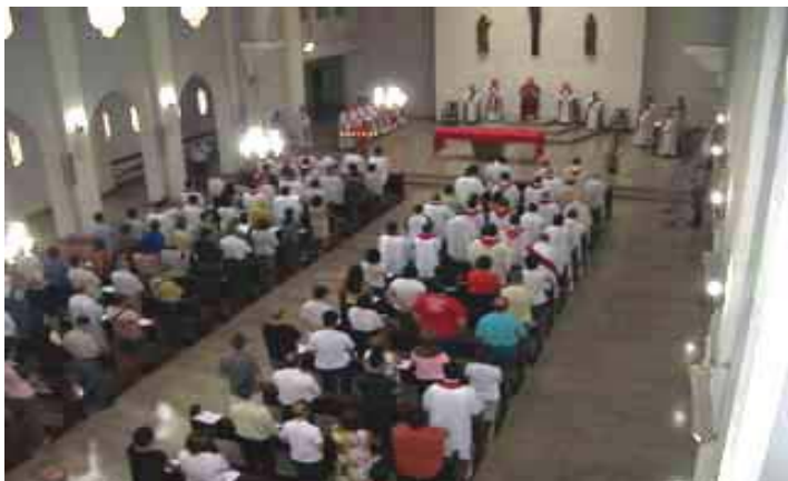
Vista geral da Capela central do Mosteiro de Vila Kostka durante celebração Eucarística presidida pelo Bispo de Caraguatatuba Dom Antonio Carlos Altieri.

A 30ª Assembléia das Igrejas Particulares do Estado de São Paulo (Regional Sul 1 da CNBB) foi realizada no período de 17 a 19 de outubro, com o tema "Como formar Missionários nas nossas Paróquias".