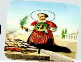
São Lourenço Diácono

INFORMATIVO DA COMISSÃO REGIONAL DOS DIÁCONOS SUL 1 ANO II - N.º 24 - SETEMBRO DE 2008