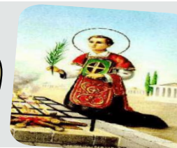
São Lourenço Diácono

INFORMATIVO DA COMISSÃO REGIONAL DOS DIÁCONOS SUL I ANO II - Nº 21 - JUNHO DE 2008