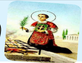
São Lourenço Diácono

INFORMATIVO DA COMISSÃO REGIONAL DOS DIÁCONOS SUL I ANO II - Nº 20 - MAIO DE 2008