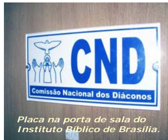
Placa na porta de sala do Instituto Bíblico de Brasília.