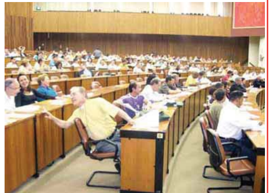
Leigos de todas as Sub-regiões e Dioceses participaram da Assembléia das Igrejas do Estado.