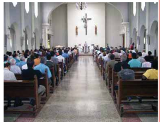
Celebração inicial da Assembléia foi presidida por Dom Odilo Pedro Scherer.