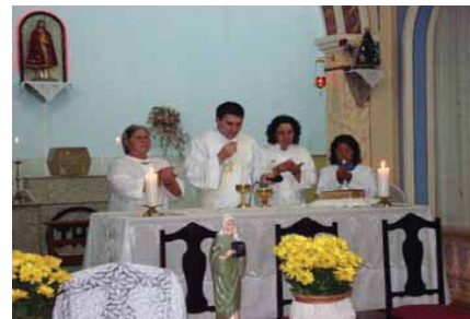
Celebração da Palavra.