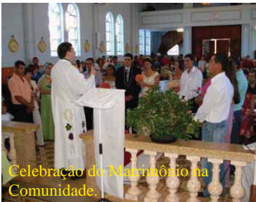
Celebração do Matrimônio na Comunidade.